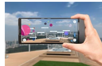
▲AR展望ガイド「WORLD SCOPE」 利用イメージ

「SHIBUYA SKY」では、株式会社NTTドコモと共同で開発したAR展望ガイド「WORLD SCOPE(ワールドスコープ)」を提供します。東京の名所を一望できる360°パノラマビューを有する「SHIBUYA SKY」の屋上で、専用スマートフォン端末をさまざまなランドマークに向けてかざし、画面をタッチすることで、端末のカメラを通してランドマークやその先にある都市などの地名や施設情報を見ることができます。屋上から見えるランドマークのほか、日本のランドマーク、世界のランドマークなど、3種類のレイヤーでガイドを楽しむことができます。また、端末へのタッチ操作で、ランドマークの基礎情報だけでなく、CGアニメーションを表示することができ、利用者同士がCGアニメーションで彩られていく景色を共有し、リアルタイムに、一緒に楽しむことができる機能を備えています。