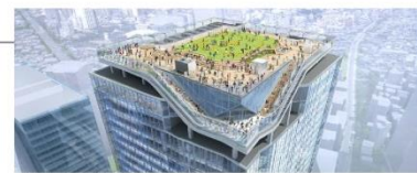
SHIBUYA SKY 展望イメージ