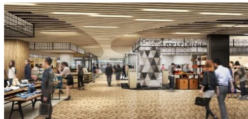
▲商業施設フロアイメージ