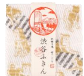
▲渋谷ふきん /渋谷てぬぐい

※限定商品および開業記念キャンペーンの詳細は、「限定商品・開業キャンペーン」の一覧資料をご参照ください