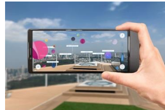
▲AR展望ガイド「WORLD SCOPE」 利用イメージ

14階・45階～屋上の展望施設「SHIBUYA SKY」、17階～45階のオフィス、15階の産業交流施設「SHIBUYA QWS」、地下2階～14階の商業施設で構成される本施設は、11月1日（金）10時に開業します。