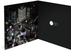
▲フォトサービス台紙イメージ