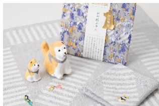
▲中川政七商店 渋谷スクランブルスクエア限定商品

渋谷スクランブルスクエア株式会社は、渋谷エリアで最も高い約230m、地上47階建ての大規模複合施設「渋谷スクランブルスクエア第1期（東棟）」（以下、本施設）にて、開業プロモーションおよび本施設限定商品を発表するとともに、展望施設「SHIBUYA SKY（渋谷スカイ）」、産業交流施設「SHIBUYA QWS（渋谷キューズ）」の最新情報について発表します。