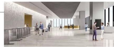
オフィスロビーイメージ