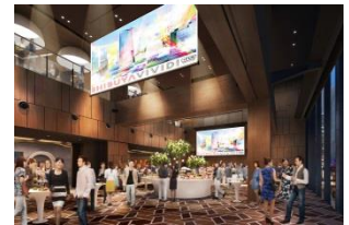
▲Scene12 (シーン トゥエルブ) のイメージ