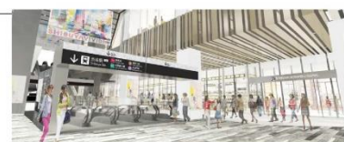
1階アーバンコア イメージ(北側より)