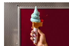
▲SHIBUYA SKY ラムネソフトクリーム

45階・46階にあるスーベニアショップ<SHIBUYA SKY SOUVENIR SHOP(シブヤスカイスーベニアショップ)>(運営:株式会社東急レクリエーション)では、中川政七商店とのコラボ商品となる「渋谷ふきん/渋谷てぬぐい」を限定デザインで販売します。