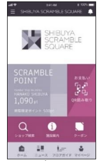
▲公式アプリ ホーム画面

開業に先駆け10月中旬より、「渋谷スクランブルスクエアアプリ」のダウンロードおよび会員登録をスタートします。