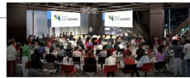
SHIBUYA QWS SCRAMBLE HALL イメージ