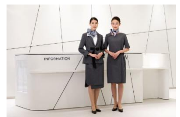
▲インフォメーションユニフォーム

今回のユニフォームデザインは渋谷という街が持つ多様性に着目しながら、さまざまな新しい価値観を発信する館の案内人として、また、さまざまな世代の方々とコミュニケーションをとる立場の方が着用するものとして、モダンでありながらも信頼のある印象に仕上げたいと考えました。