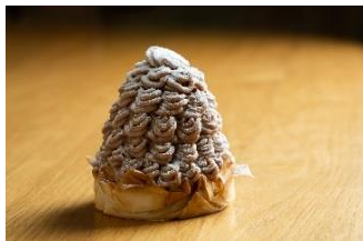
▲MORI YOSHIDA PARIS モンブラン