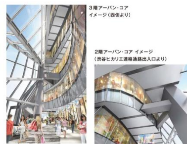
3階アーバンコア イメージ(西側より)