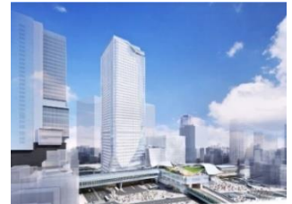
▲渋谷スクランブルスクエア (宮益坂交差点方面よりのぞむ)