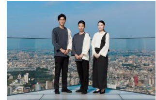
▲チケットカウンタースタッフ(右) 案内スタッフ(左・中)

デザイナーは内閣総理大臣賞をはじめとする数々のグランプリの受賞や、コレクション実績を持つ天津憂氏が担当。スタッフが身にまとうユニフォームを、「SHIBUYA SKY」が提供する非日常体験の重要な1要素と捉え、一目でスタッフとわかる機能性を持ちながらも、強く主張しない存在感と、トレンドに左右されない普遍性を備えた、シンプルで上質なデザインを目指しました。